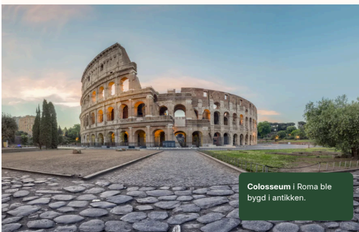
Colosseum i Roma ble bygd i antikken.

I dag er Roma hovedstaden i Italia. Byen er ikke i nærheten av så stor som det gamle Romerriket var. Men de store monumentene, som Colosseum og Forum Romanum, står der fortsatt.